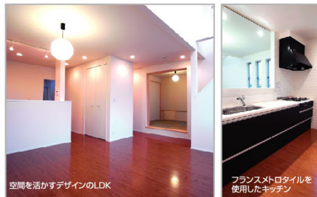
空間を活かすデザインのLDK