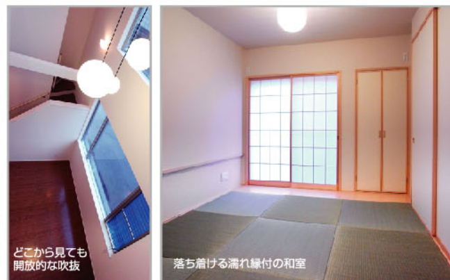
どこから見ても開放的な吹抜