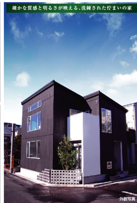
確かな質感と明るさが映える、洗練された佇まいの家